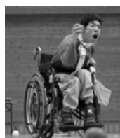
息子の公輔も夢中!

詳しくは、兵庫県社会福祉士会阪神ブロック(電話 0798-22-7551 FAX0798-32-0853 e-mail:office-u@remus.dti.ne.jp)まで